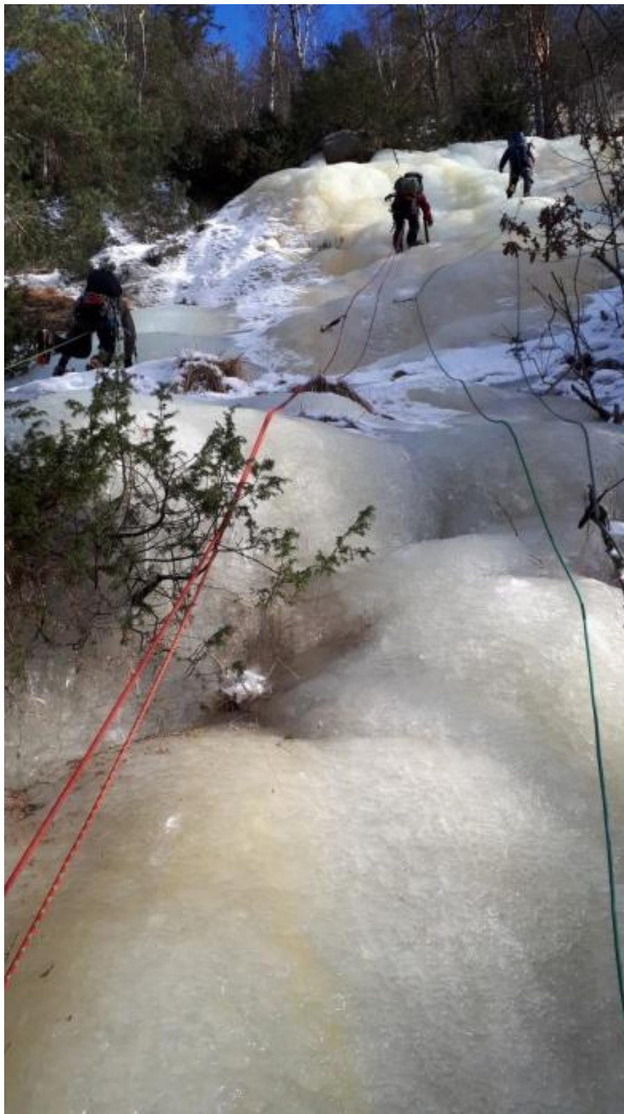
1.tl WI 2-3 ca50m opp til ett tre under sektor 3. Førstebestiger Lars Wegge og Einar Morland 2012.