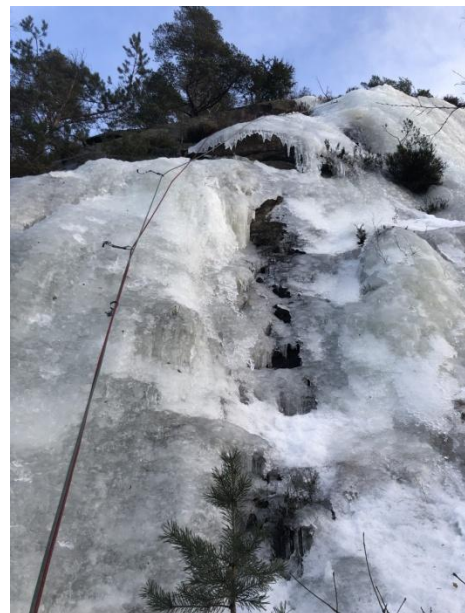
Venstre bilde: Surf n turf WI 3 , 30m opp til hylle. Tynn og utfordrende sikret. Harald Bakken nov 2023